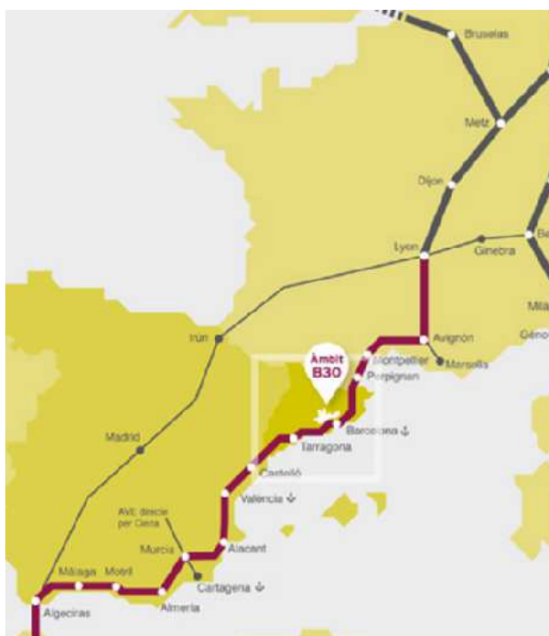
Àmbit B-30.

Així, en primer lloc i com ja s'ha apuntat anteriorment, l'any 2012 un conjunt d'ajuntaments i altres institucions van decidir crear una associació al voltant de l'anomenat "àmbit B-30" amb l'objectiu de "definir i desenvolupar una estratègia de col·laboració entre institucions de sectors diversos per incentivar l'economia productiva a la zona industrial i tecnològica del territori i per posicionar aquest territori com una de les regions industrials amb més potencial innovador de Catalunya, d'Espanya i del sud d'Europa" (article 3 dels seus estatuts). Aquestes institucions que conformen l'associació àmbit B-30 són empreses, centres de recerca, universitats, administracions locals, organitzacions empresarials, organitzacions sindicals i governs.