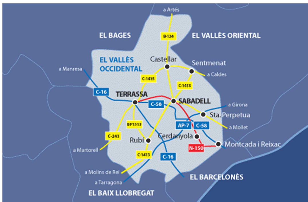
Mapa de carreteres del Vallès Occidental.

Sabadell es troba en un emplaçament òptim, al centre de la zona més potent econòmicament del sud d'Europa representada per la ciutat de Barcelona, a uns 25km. La xarxa de transport terrestre que envolta Sabadell és extensa, tal com mostra el següent mapa de carreteres del Vallès Occidental. La carretera C-58 o Autovia del Vallès ressegueix Sabadell de nord a sud i connecta la ciutat amb Terrassa, a l'est (on conflueix amb la C-16), i amb Barcelona, a uns 15km al sud. Sabadell està travessada, a més, per la nacional N-150, que també uneix Terrassa amb Barcelona. A banda de la patent connectivitat amb la capital de Catalunya, cal destacar l'òptima ubicació de Sabadell per a la sortida cap al sud i l'interior de Catalunya, cap a França i cap a la resta d'Europa: en efecte, l'autopista AP-7 o del Mediterrani uneix el sud d'Espanya amb Europa passant a ben pocs quilòmetres de Sabadell. Al seu pas per la comarca del Vallès Occidental, es converteix en la gratuïta B-30.