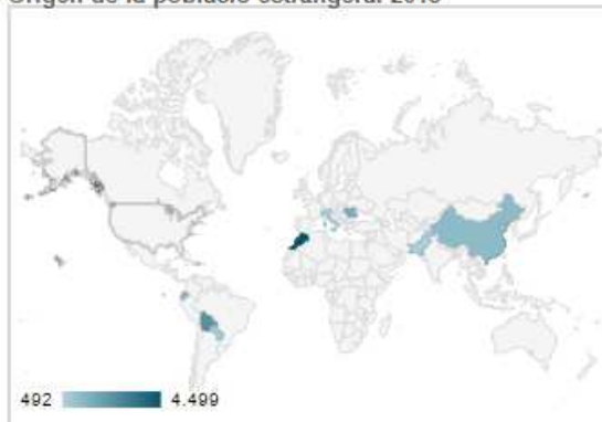
Origen de la població estrangera. 2015

Durant el període 2000-2014 a nivell comarcal la població estrangera va créixer el doble, un 25%, mentre que a la província de Barcelona va ser d'un 17% i a Catalunya, d'un 20%. Destaca, segons dades de 2015, el col·lectiu marroquí (4.499 persones), seguit del bolivià (2.531), el romanès (1.744), el xinès (1.245) i l'equatorià (1.231). Si es computa per regions a nivell global, el col·lectiu llatinoamericà representa el 40% dels immigrants a la ciutat. El col·lectiu estranger, que com s'ha mencionat representa el 10,3% del total poblacional, representa més del 22% de la població atesa pels serveis socials de la ciutat.